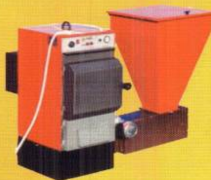
Котлы на пеллетах ECO