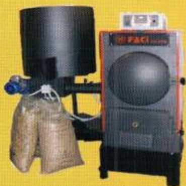
Котлы на отходах FSS