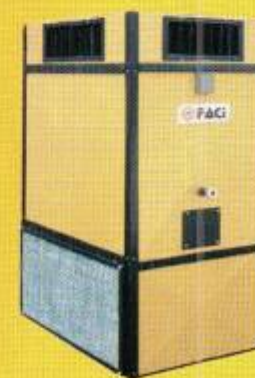
Генераторы теплого воздуха