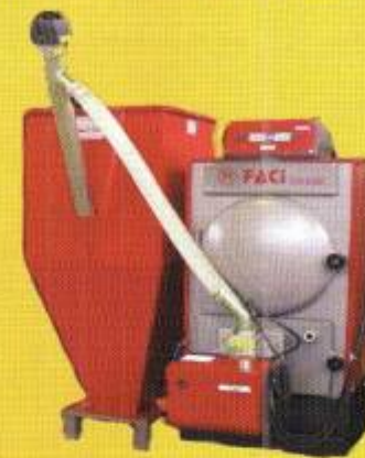
Котлы на пеллетах CBS