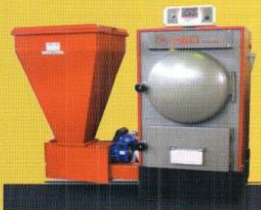
Котлы на пеллетах FACI